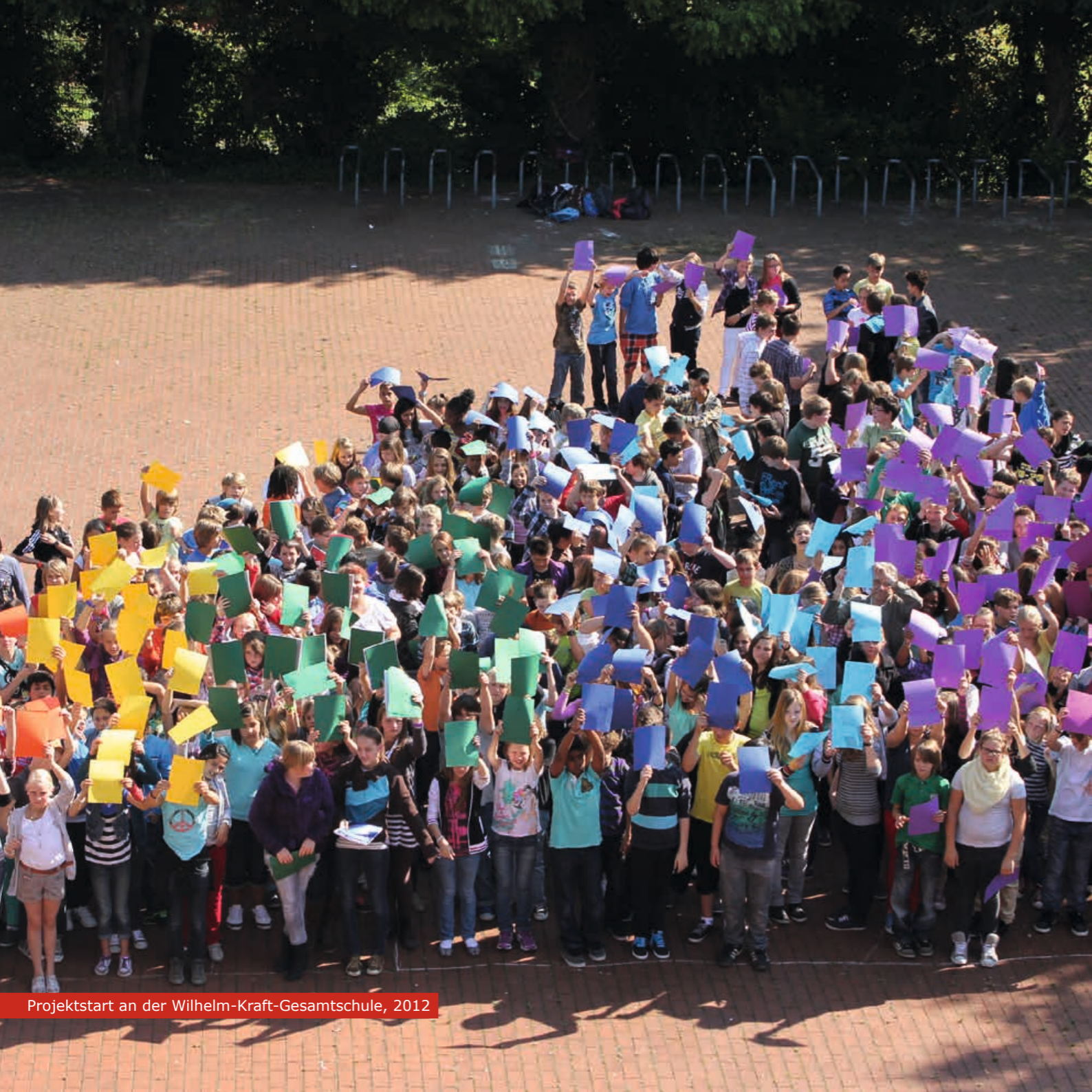
Projektstart an der Wilhelm-Kraft-Gesamtschule, 2012