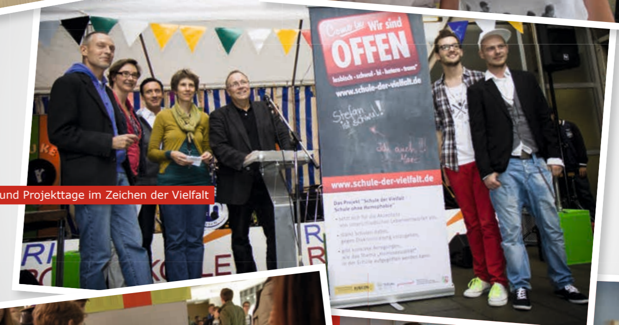
Schulfeste und Projektstage im Zeichen der Vielfalt