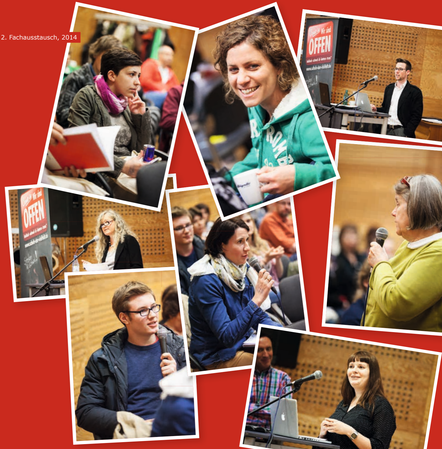
2. Fachaustausch, 2014