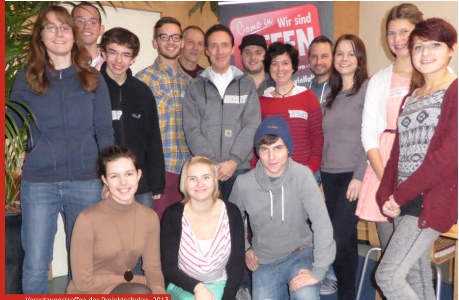
Vernetzungstreffen der Projektschulen, 2013

tätsstandards besprochen sowie eine Anerkennungskultur gepflegt, bei der die Schulen für ihre jährlichen Aktivitäten mit einer Urkunde geehrt werden. Nach den Qualitätsstandards ist die Teilnahme von mindestens einer Lehrkraft der jeweiligen Schule obligatorisch. Eine Teilnahme von Eltern und Schüler_innen ist sehr gewünscht. In der Regel können neben den bestehenden Projektschulen auch weitere interessierte Schulen teilnehmen.